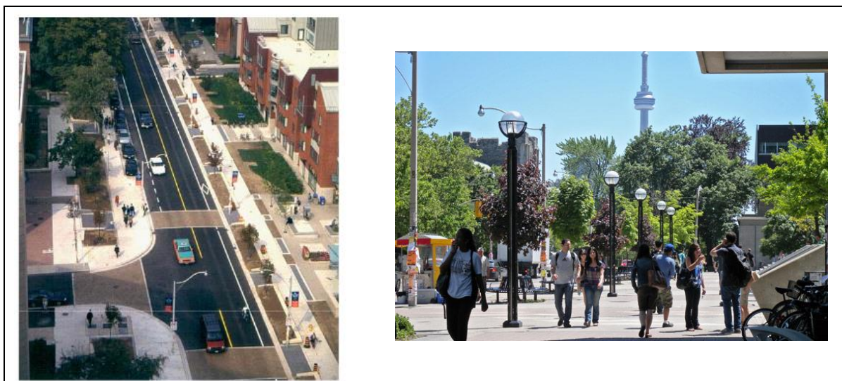
Figura 2 Duas perspectivas da St. Georges St. após a sua revitalização em 1997

cruxa de norte a sul o campus St. George da University of Toronto. Optou-se por reduzir a capacidade da via de quatro para duas faixas, implantar faixas de pedestre, alargar calçadas, manter as ciclofaixas e ampliar os espaços verdes (Transport Canada, 2005). Como resultado, a velocidade do tráfego diminuiu, as colisões no tráfego diminuíram 40%, entre 1997 e 2003, além de o volume de bicicletas ter aumentado 10% neste período. Além disso, é importante notar que o volume de automóveis foi praticamente mantido depois da revitalização da rua. A menor velocidade dos automóveis fez crescer a segurança para todos os meios de transporte e foi aumentado o espaço destinado a pedestres, ciclistas e espaços verdes, com melhoria na qualidade de vida no local (Transport Canada, 2005).